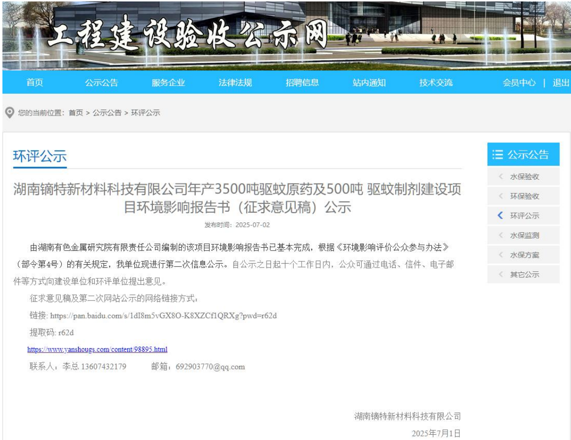
图 2 第二次网络公示截图