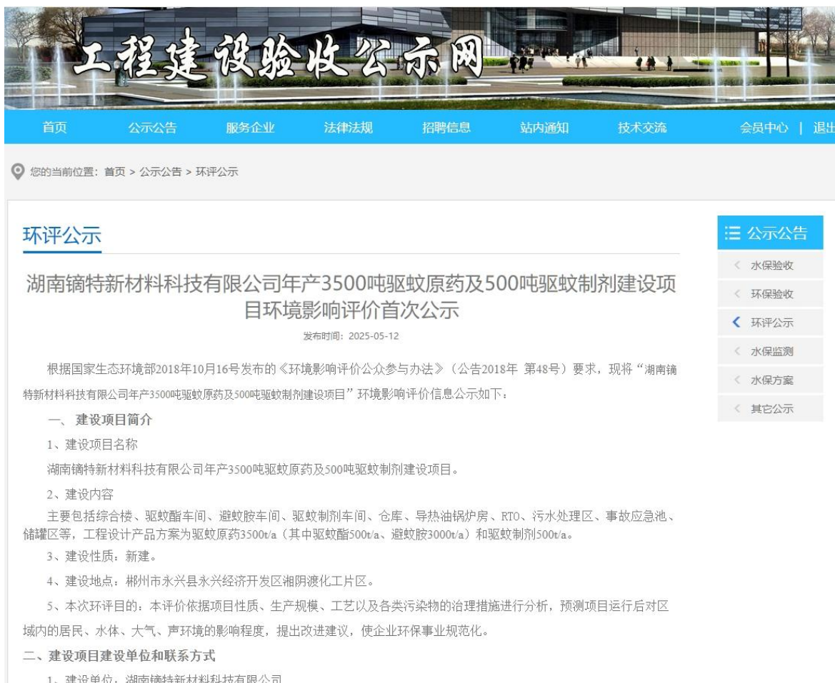
图 1 第一次网络公示截图

本次公示网站为工程建设验收公示网，为常用的建设项目信息公示网站，可信度高，且浏览量较大，可以作为本项目网络公示的载体。第一次网络公示时间为 2025 年 5 月 12 日-年 5 月 23 日。网址为： https://www.yanshougs.com/content/97245.html 。网络公示截图如图 1。