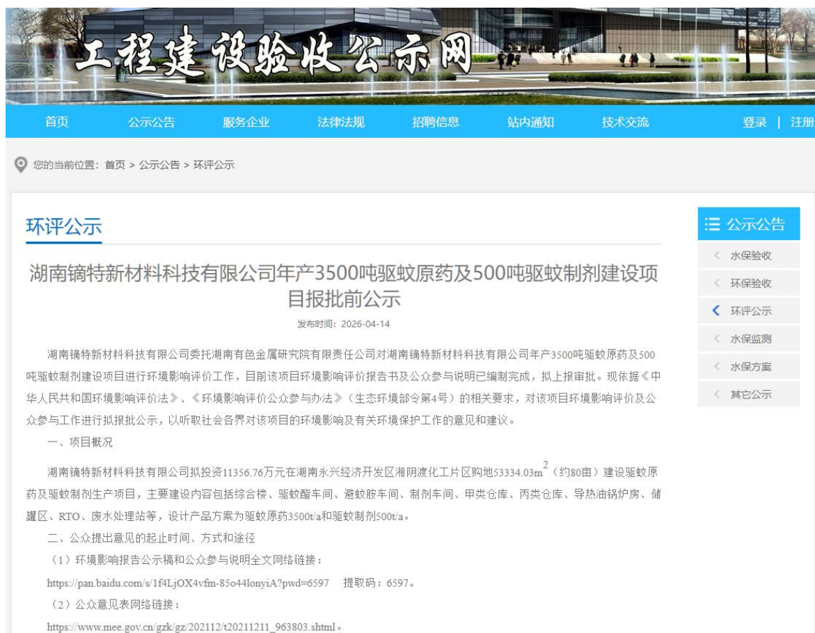
图 4 报批前网络公示截图

本次公示网站为工程建设验收公示网，为常用的建设项目信息公示网站，可信用度高，且浏览量较大，可以作为本项目网络公示的载体。网址为： https://www.yanshougs.com/content/107394.html 。网络公示截图如图 4。