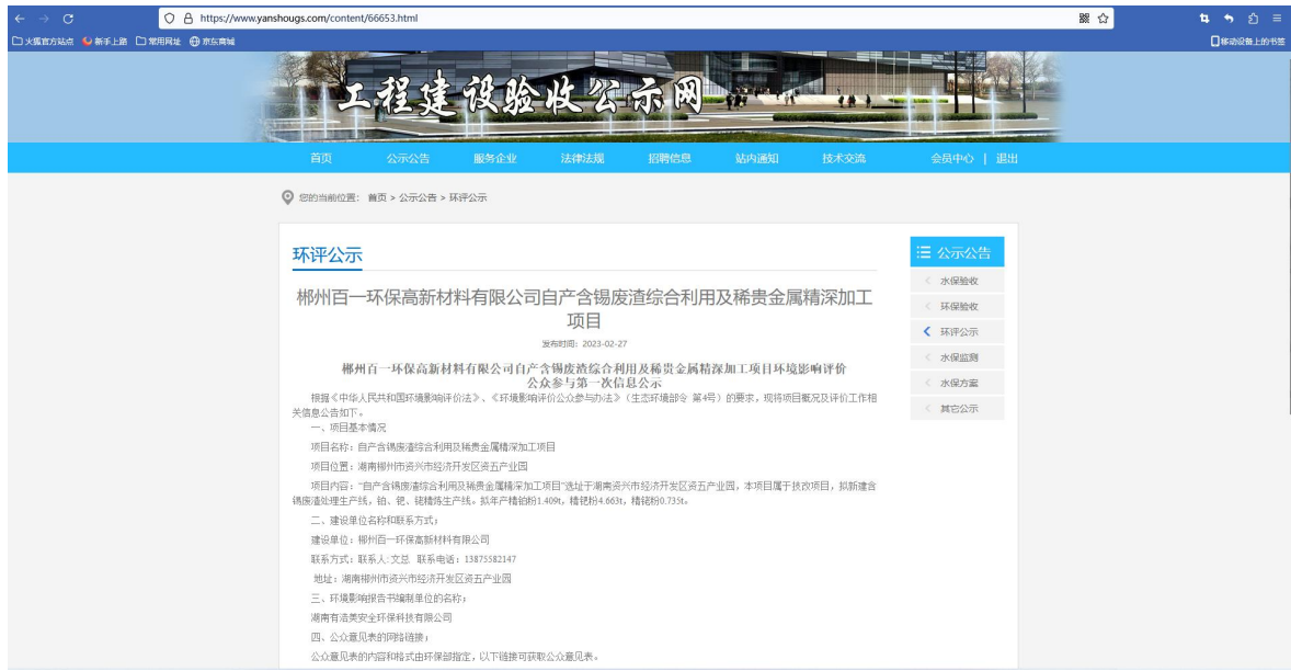
图 1 本项目公众参与第一次网络公示

百一公司于 2023 年 2 月 27 日在工程建设验收公示网上进行了首次公示，详见图 1。