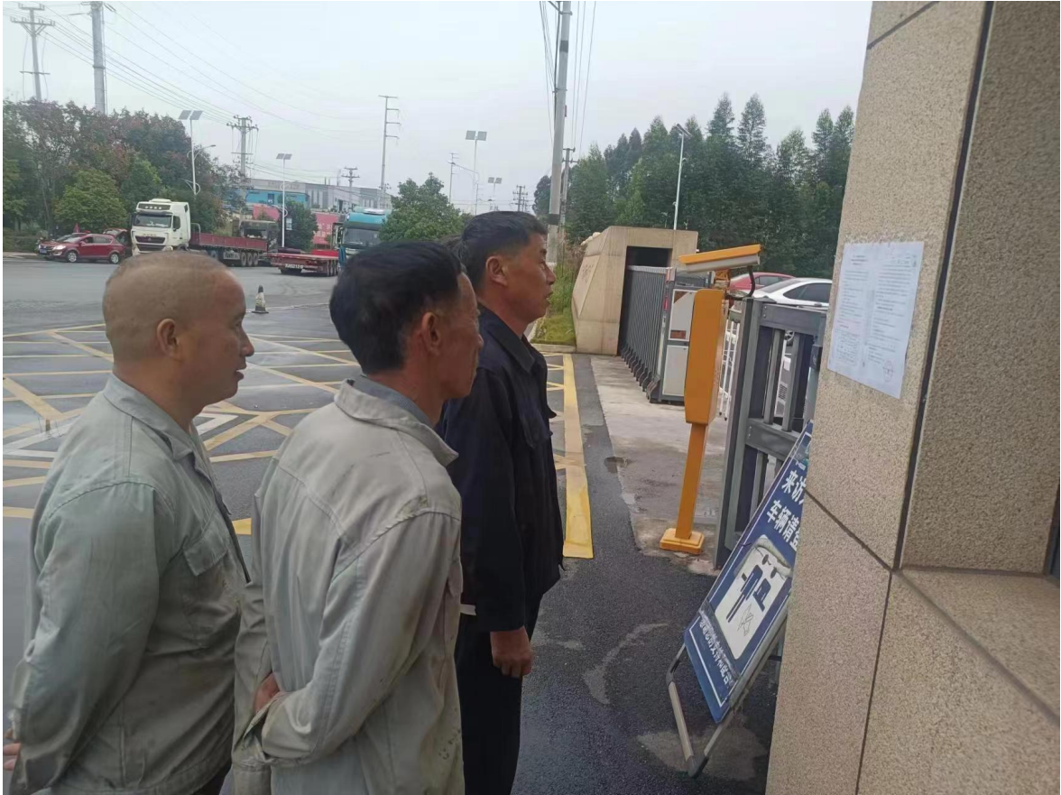
图 4 本项目公共参与现场公示