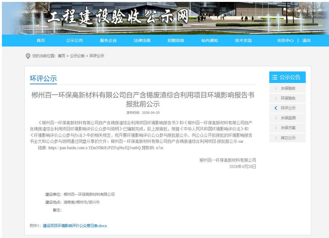
图 5 报批前网络公示截图

本次公示网站为工程建设验收公示网，为常用的建设项目信息公示网站，可信度高，且浏览量较大，可以作为本项目网络公示的载体。网址为： https://www.yanshougs.com/content/107577.html 。网络公示截图如图 5。