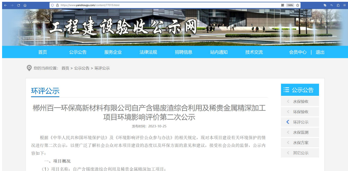
图2 本工程公众参与第二次网络公示

本次公示于2023年10月25日在工程建设验收公示网上进行了第二次网络公示，公示载体和网络公示时间符合《环境影响评价公众参与办法》的要求。公示情况见图2。