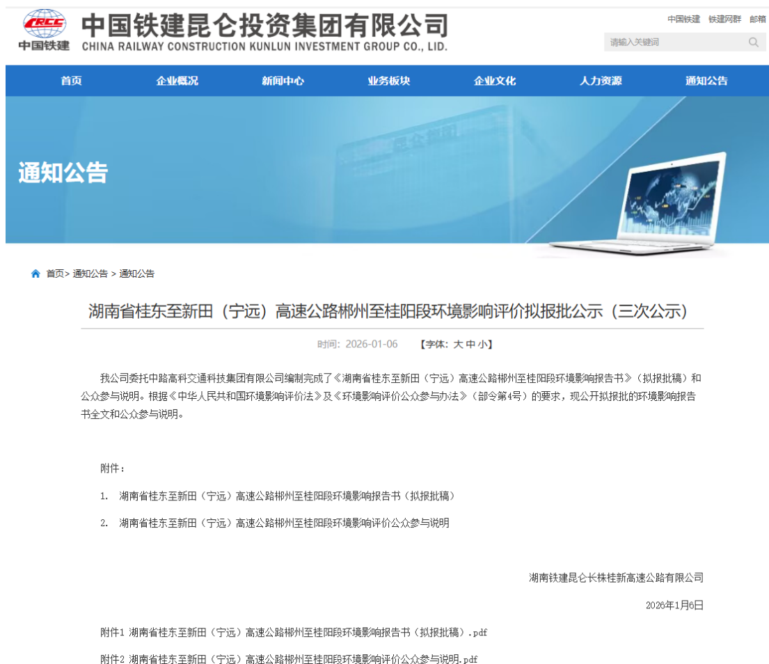
图 4.1-1 报批前网络公示截屏图