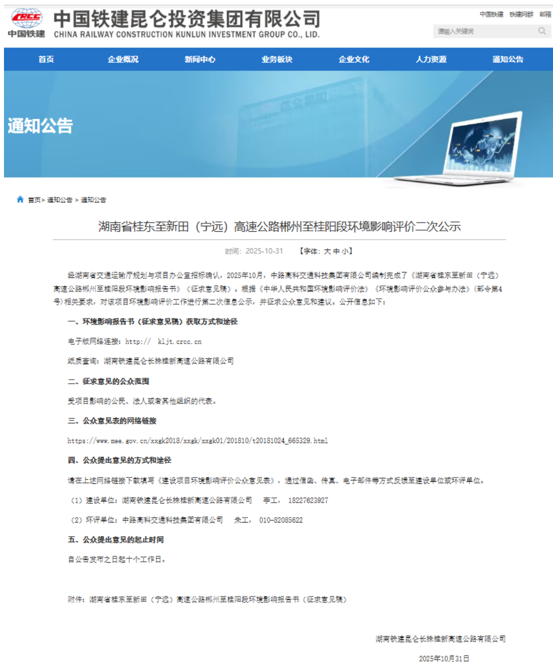
图 3.2-1 环境影响报告书征求意见稿网络公示截图