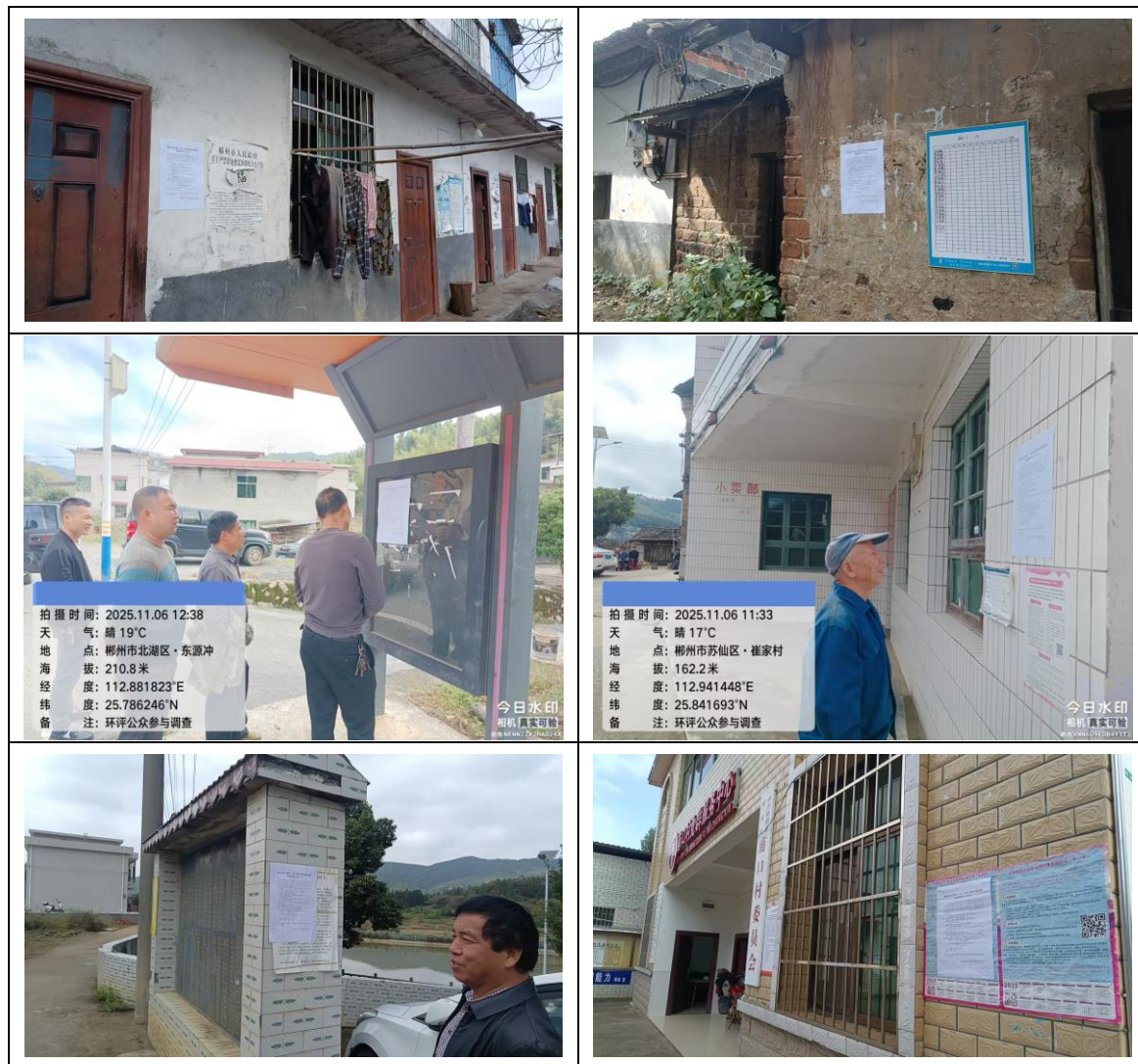
图 3.2-4 沿线村镇张贴照片