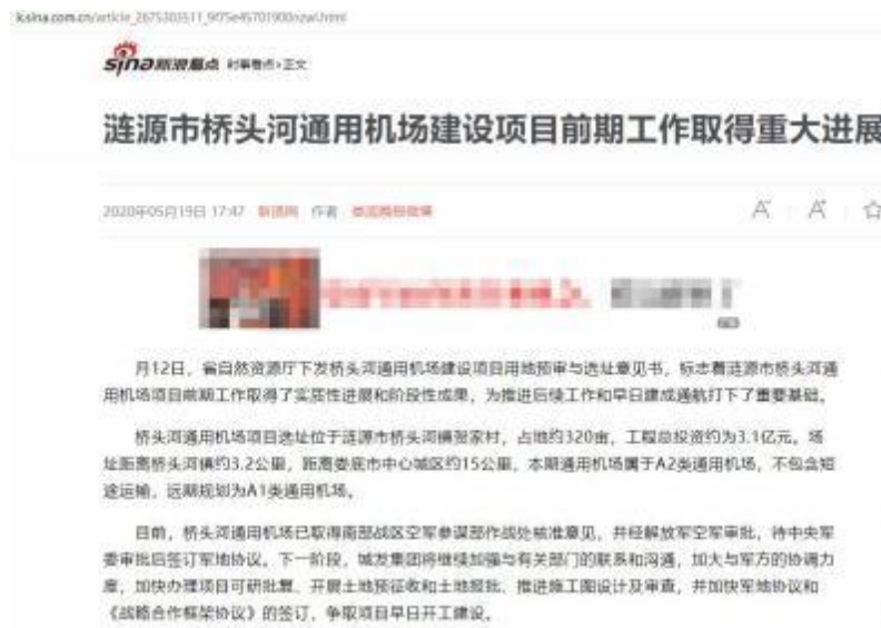
图 4-2 项目进展公示

2020年5月19日，娄底晚报新浪微博对本项目建设前期工作进行了报道 ( http://k.sina.com.cn/article_2675303511_9f75e45701900nzw1.html )。