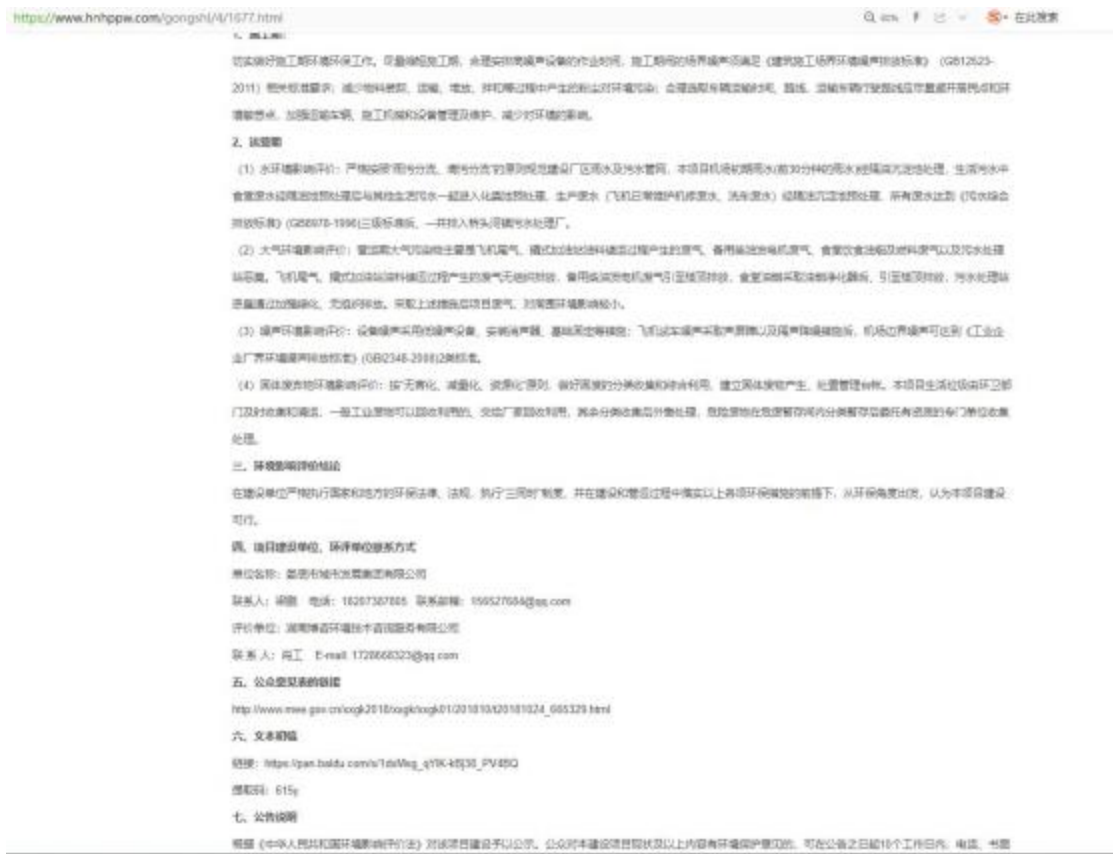
图 3-1 第二次网上公示截图