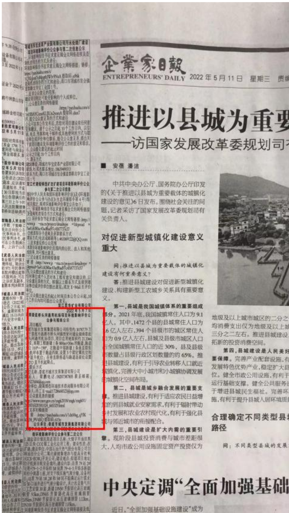
图 3-2 报纸公示内容截图