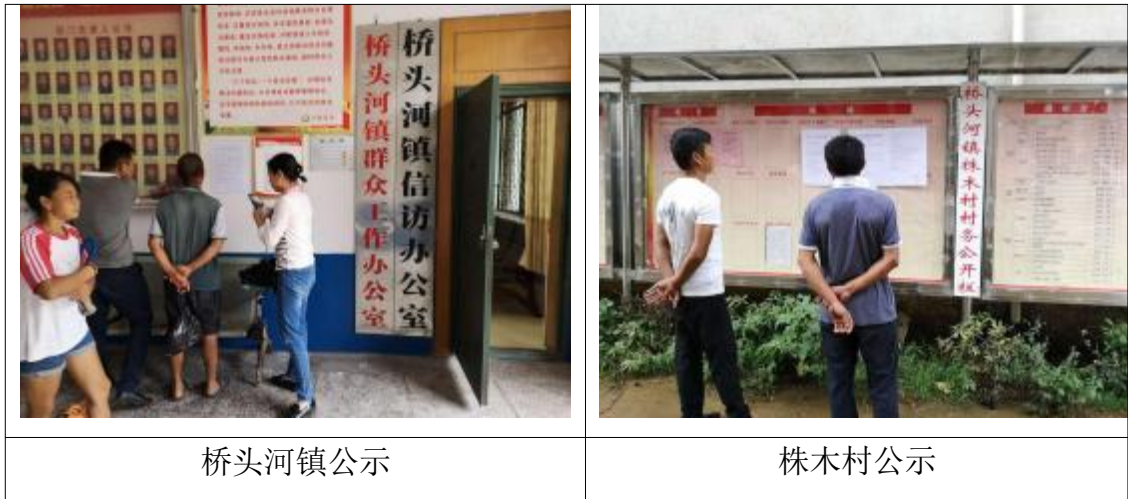
图 3-3 现场公示照片