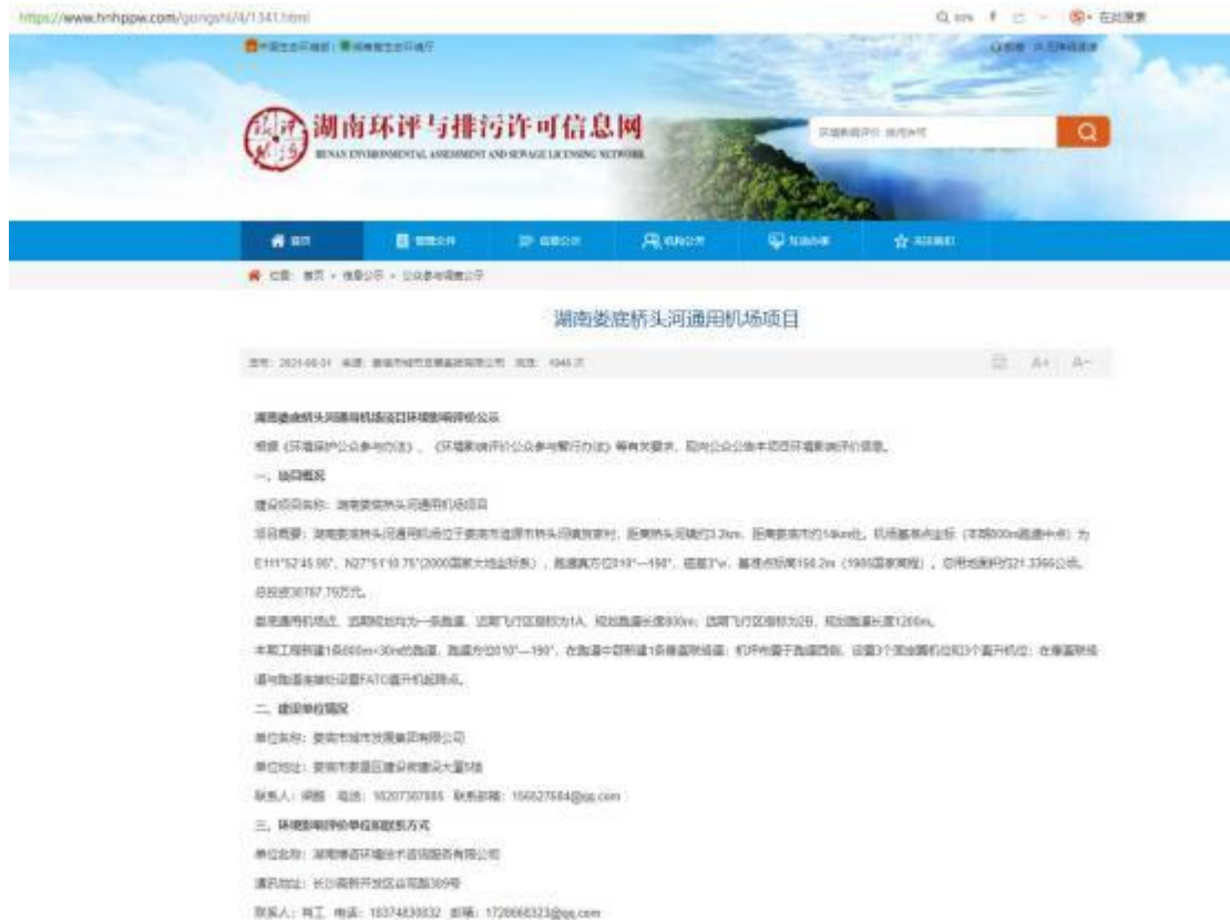
图 2-1 第一次网上公示截图