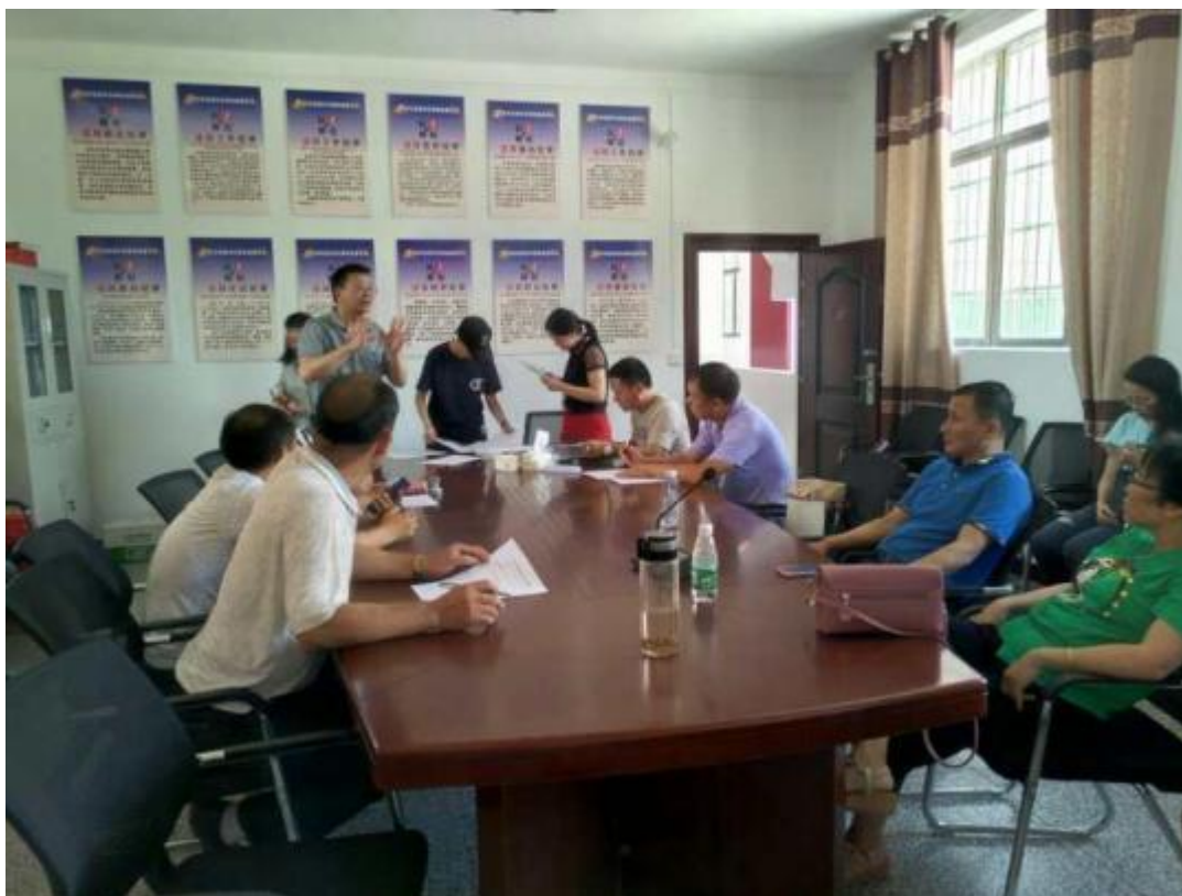
图 4-3 项目座谈会现场

根据本项目社会稳定风险分析评价期间公众参与座谈会个公众问卷调查结果，参与调查的群众均表示支持项目建设，认为本工程对当地的经济展有利，有涉及到征地范围的村民比较关心是否可以获得合理的征地拆迁补偿，表示愿意配合征迁。但工程建设也会带来一定的环境影响，施工时会带来出行不便，群众希望采取有效措施予以缓解。