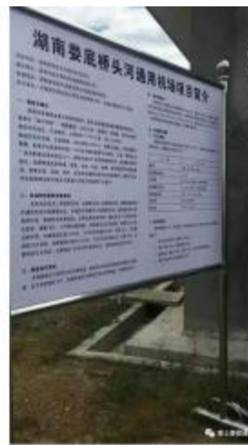
娄底（桥头河）通用机场项目公示牌