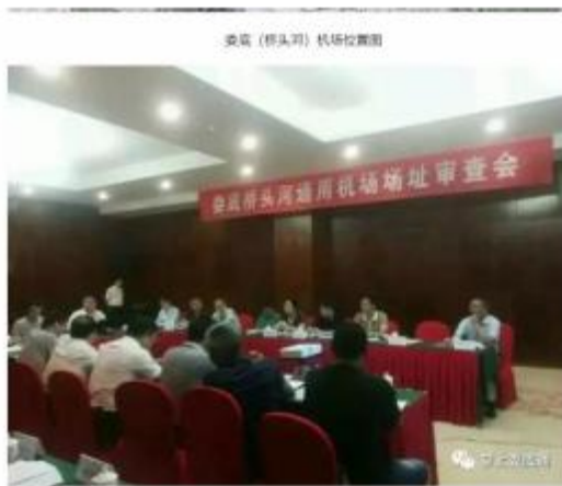
娄底（桥头河）机场选址审查会

9月7日下午，娄底（桥头河）通用机场项目论证会召开，中国航空规划设计研究总院专家与娄底相关方面对项目进行了前期论证。他们到底说了什么呢？