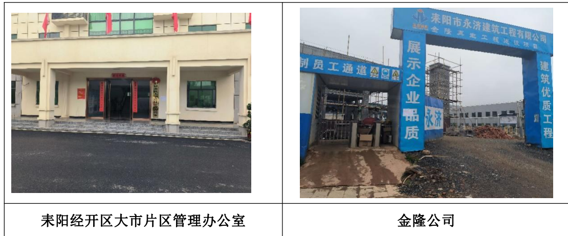
图 3.4-1 现场公示照片