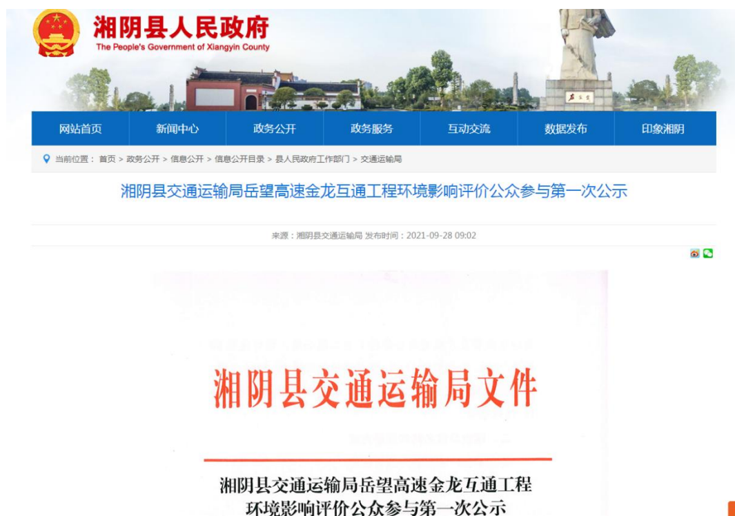
图 2.2-1 公众参与信息第一次公示网站截图

第一次公众参与网络公示于2021年9月28日在湘阴县人民政府官网( http://www.xiangyin.gov.cn/31185/32018/32020/32034/index.html )进行,详见图2.2-1。