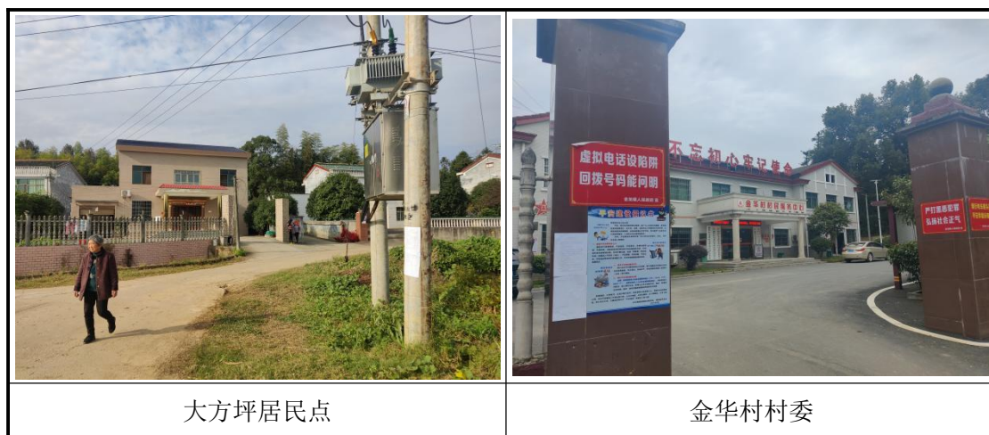
图 3.2-4 征求意见稿形成后现场张贴公示情况