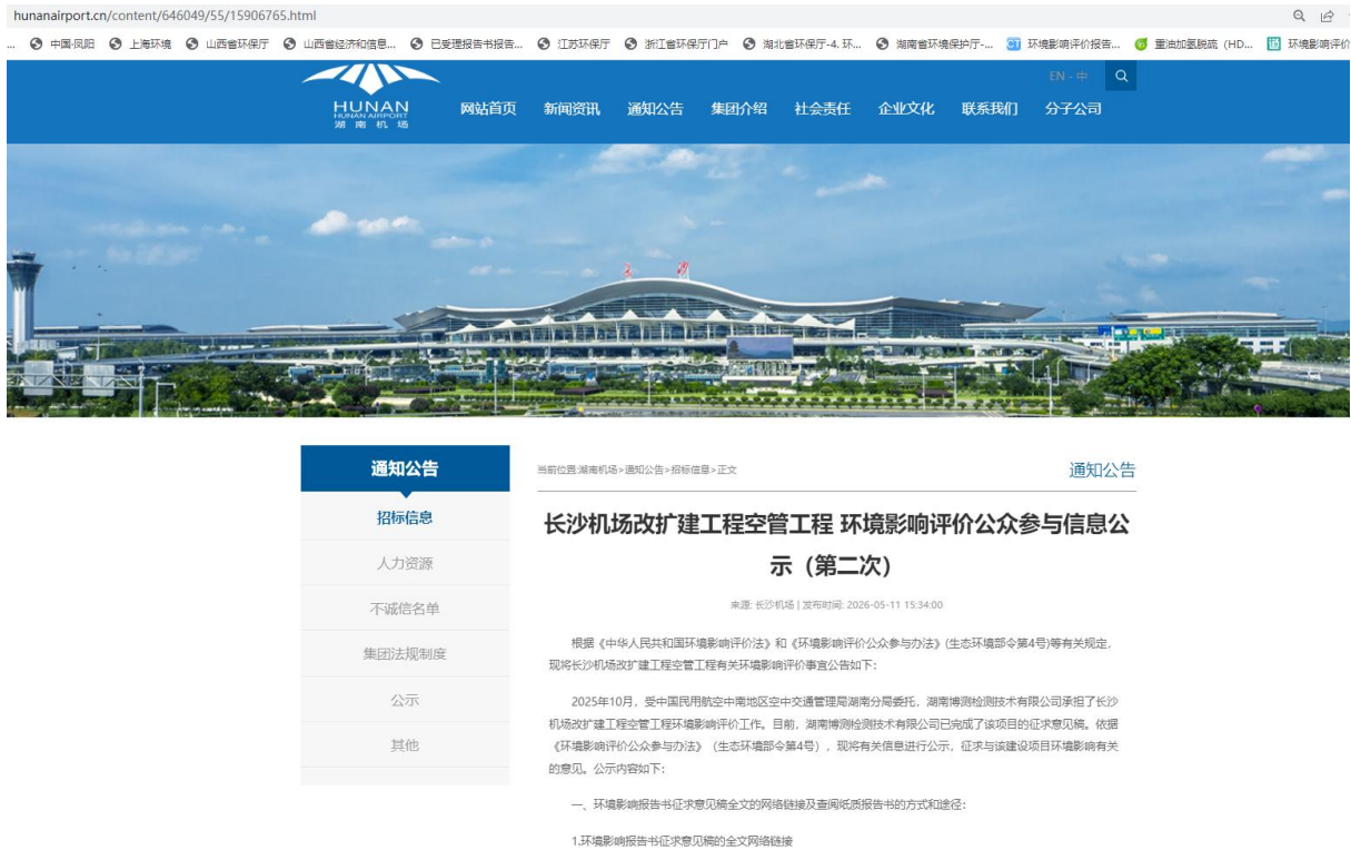
图 3.2-1 征求意见稿网上公示截图