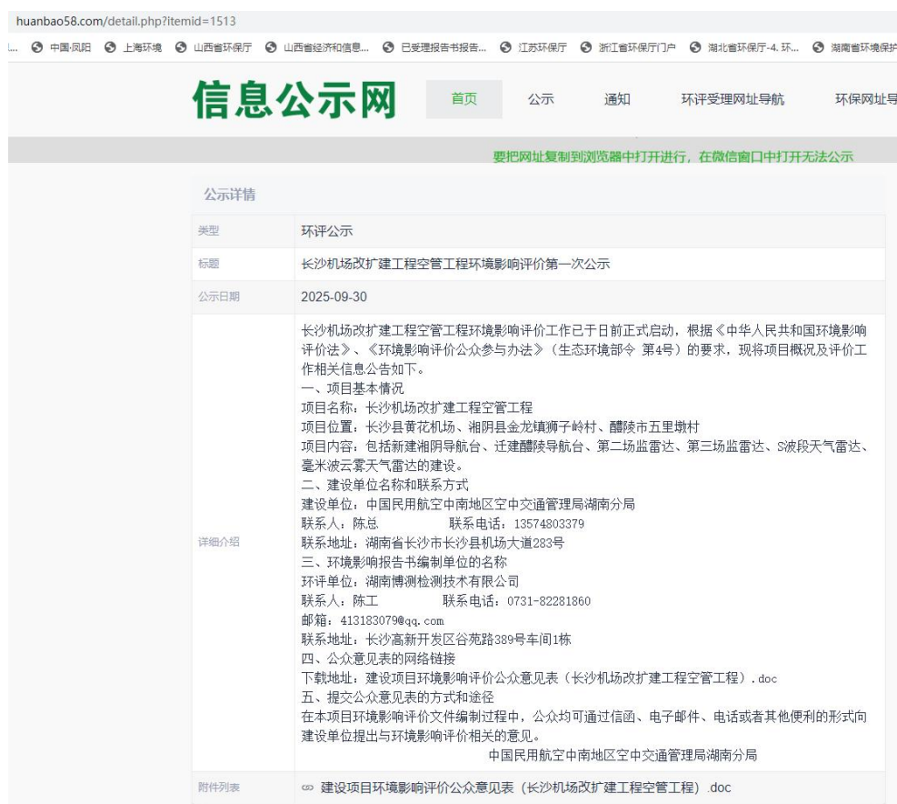
图 2.2-1 第一次网上公示截图