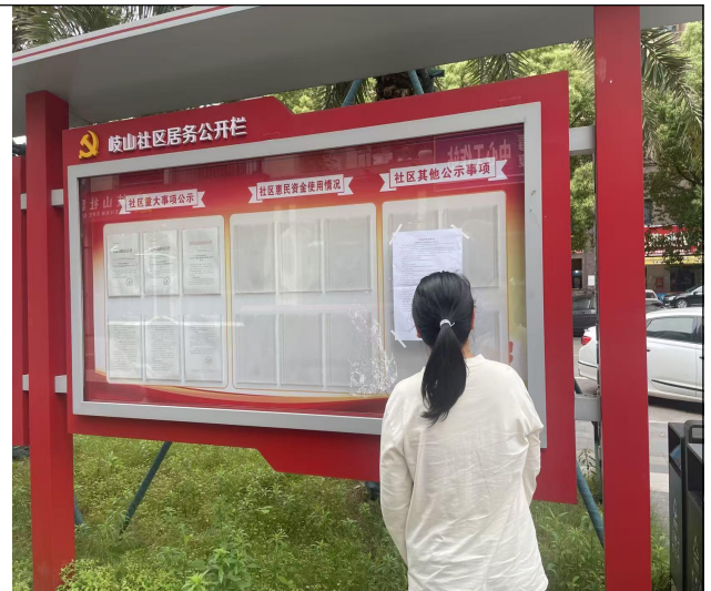
第二场监雷达站、毫米波云雾天气雷达站所在的长沙县黄花镇岐山社区居民委员会公告栏