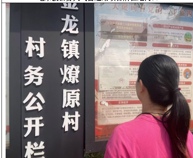
湘阴县金龙镇燎原村村民委员会公告栏