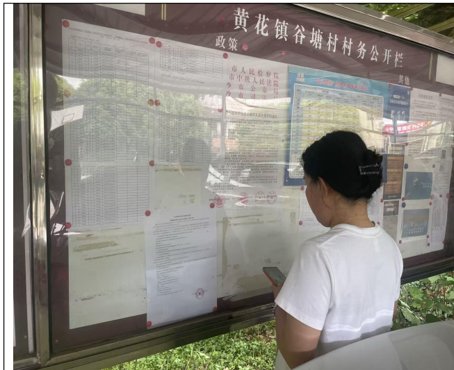
第三场监雷达站所在的长沙县黄花镇谷塘村民委员会公告栏