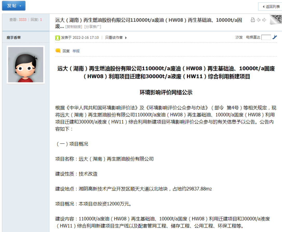
图 2 网络公示截图