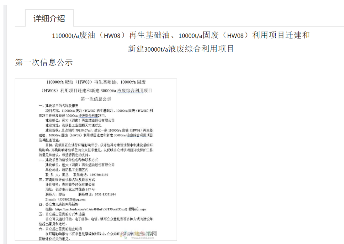
图 1 首次网络公示截图

建设单位在 2021 年 11 月 15 日在岳阳生活网进行了第一次网络公示,在环境影响报告书征求意见稿编制过程中,公众均可向建设单位提出与环境影响评价相关的意见,网址为: https://yueyang.bdsh5.com/html/2797571.shtml 。公示截图见图 1。