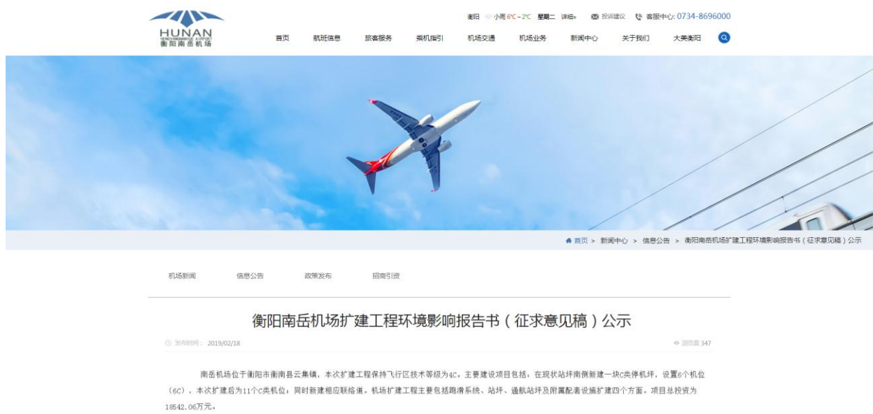
图 4.2-1 征求意见稿网络公示截图