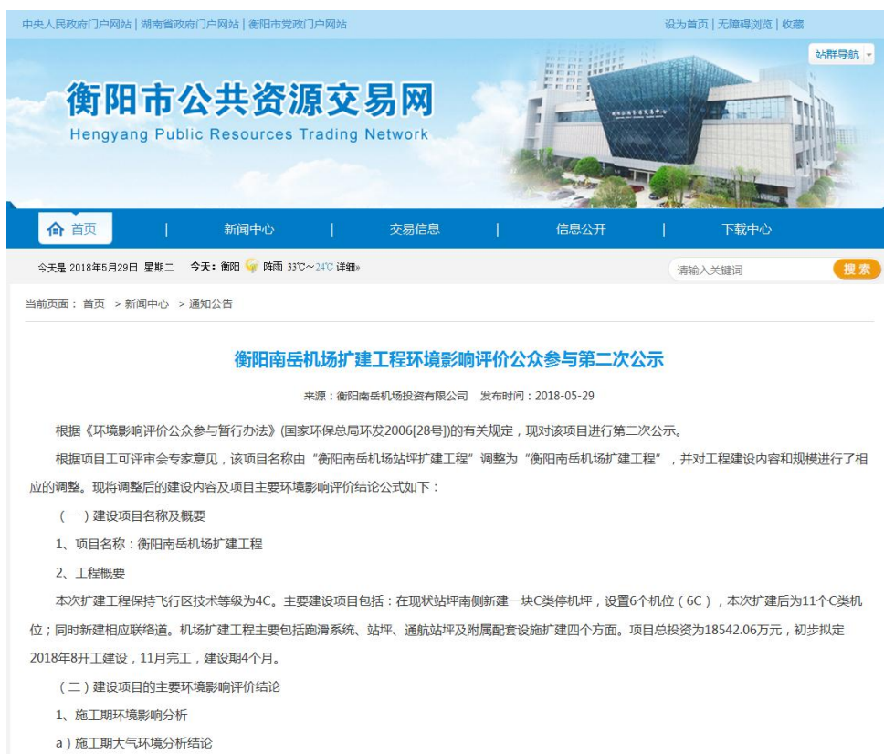
图 3.1-1 第二次网络公示