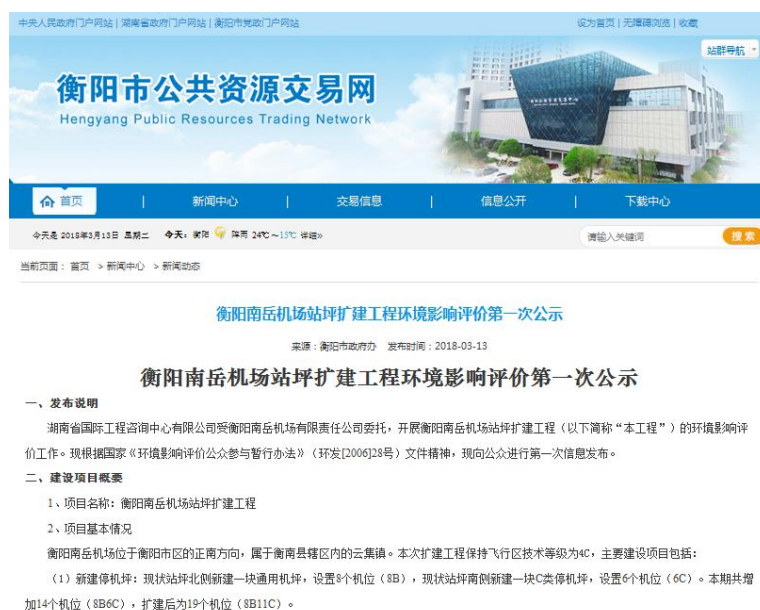
图 2.2-1 第一次网络公示

( http://ggzy.hengyang.gov.cn/xwzx/xwtd/201803/t20180313_1967056.html ) 上对本项目进行了第一次信息公示，见图 2.2-1。