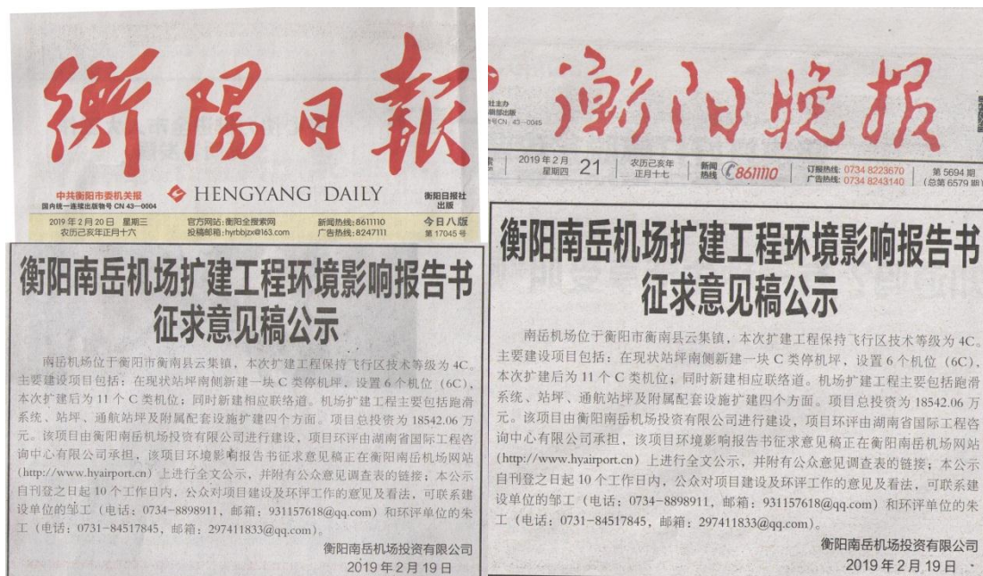
图 4.2-2 征求意见稿报纸公示

我公司于 2019 年 2 月 20 日和 2 月 21 日分别在《衡阳日报》、《衡阳晚报》上对本项目建设情况和环评报告书征求意见稿、公众意见调查表的链接进行了公示。报纸公示内容见图 4.2-2。