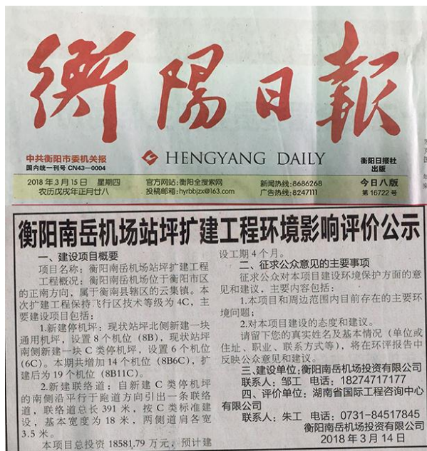
图 2.2-2 报纸公示

2018年3月15日，我公司在《衡阳日报》上刊登了项目环境影响评价公示的信息公告，见图 2.2-2。