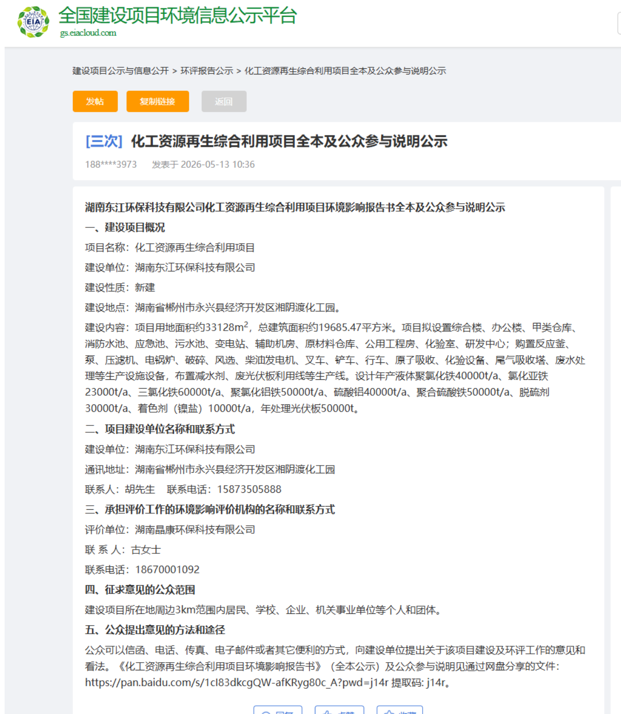
图6 报批前网上公示

台”官网进行了互联网公示，接受公众参与意见。链接： https://www.eiacloud.com/gs/detail/1?id=6051349YXc ，公示情况见下图。