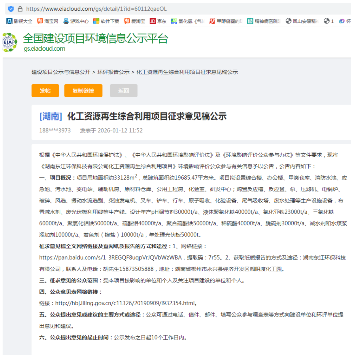
图2 征求意见稿网上公示

https://www.eiacloud.com/gs/detail/1?id=60112qaeOL 。公示截图见图2。