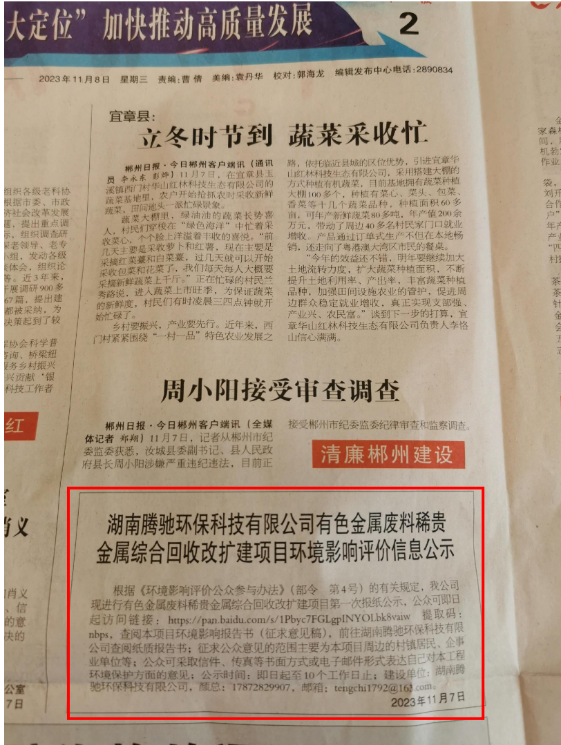
图 3-1 2023 年 11 月 8 日第一次报纸公示截图