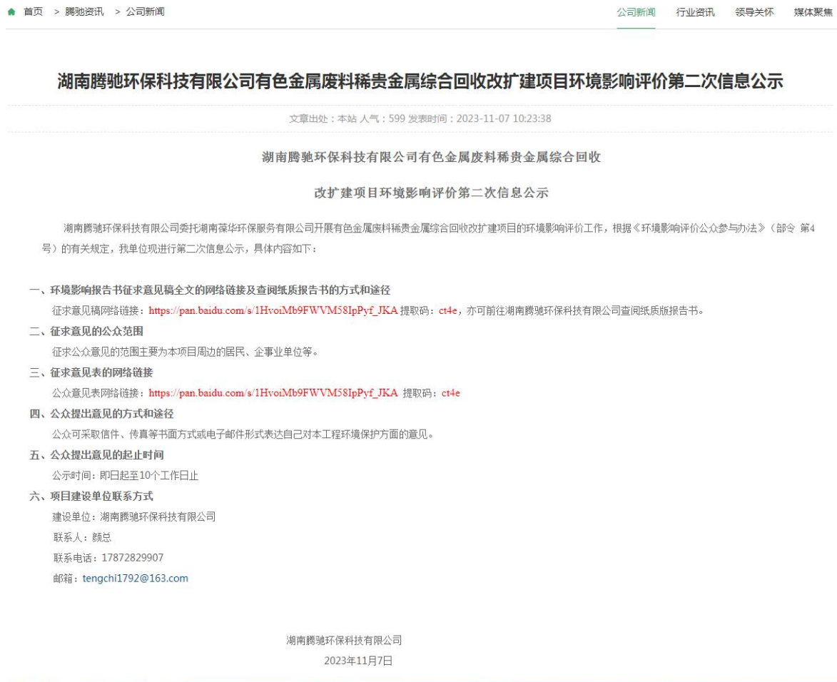
图 2 第二次网络公示截图

腾驰公司于 2023 年 11 月 7 日在其官方网站上进行了第二次网络公示(见图 2)。 网址： http://www.hntchbkj.com/gongsixinwen/207.html