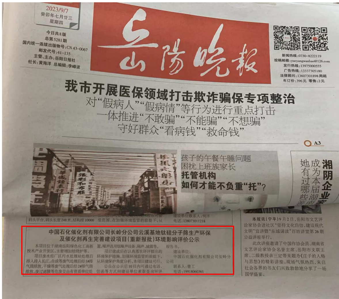
图 3-1 项目报纸上公示图片（第一次）