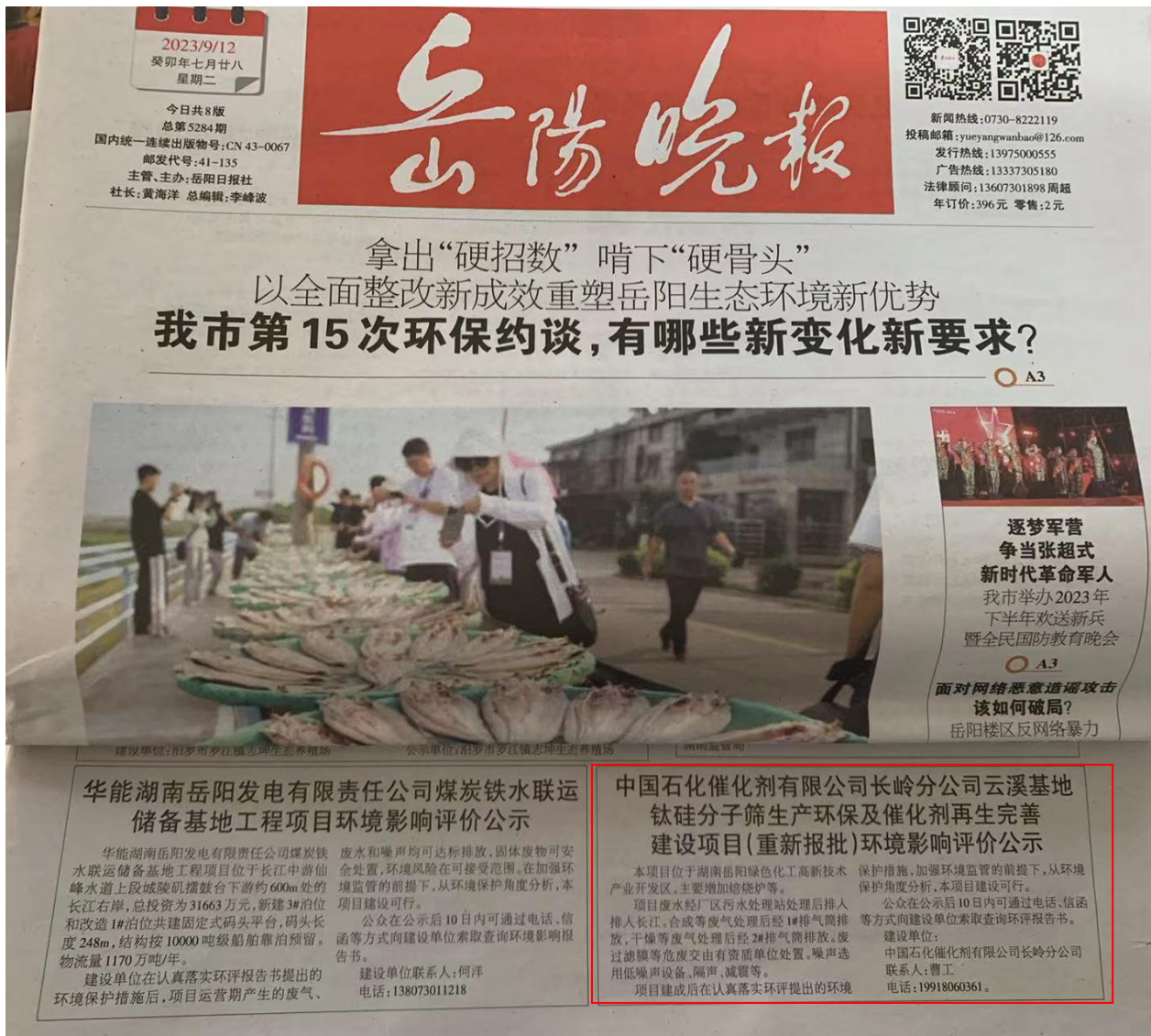
图 3-2 项目报纸上公示图片（第二次）