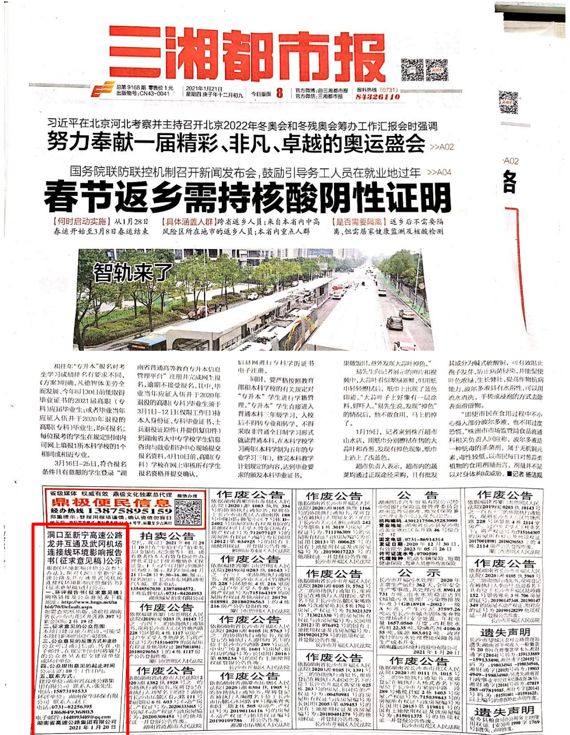
图4 2021年1月21日征求意见稿信息报纸公示

2021年1月21日、1月26日，湖南省高速公路集团有限公司在《三湘都市报》刊登了项目环评信息，《三湘都市报》当地公众易于获取且普及性较高，是湖南省内发行的报刊，具有一定的权威性的社会影响力，符合《办法》中第十一条的规定。报纸信息公示情况见图4与图5。