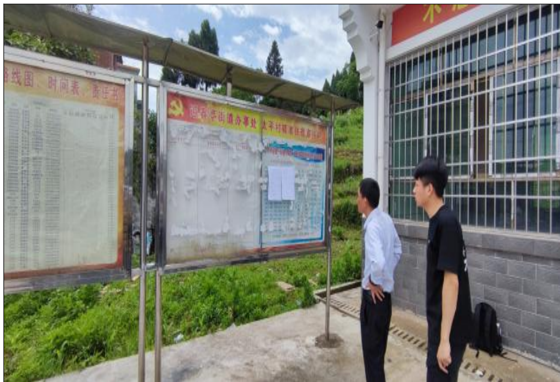
太平村村民委员会

现场张贴地点选取在建设项目所在地公众易于知悉的场所，公示时间均在连续十个工作日内，符合《办法》中第十一条的规定。