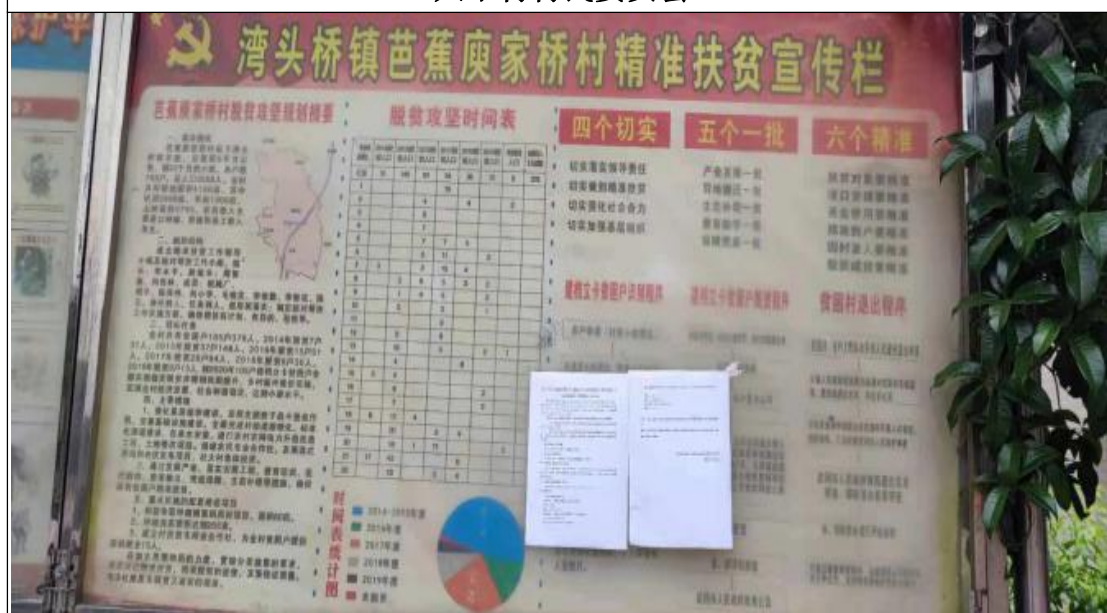
芭蕉庾家桥村村民委员会