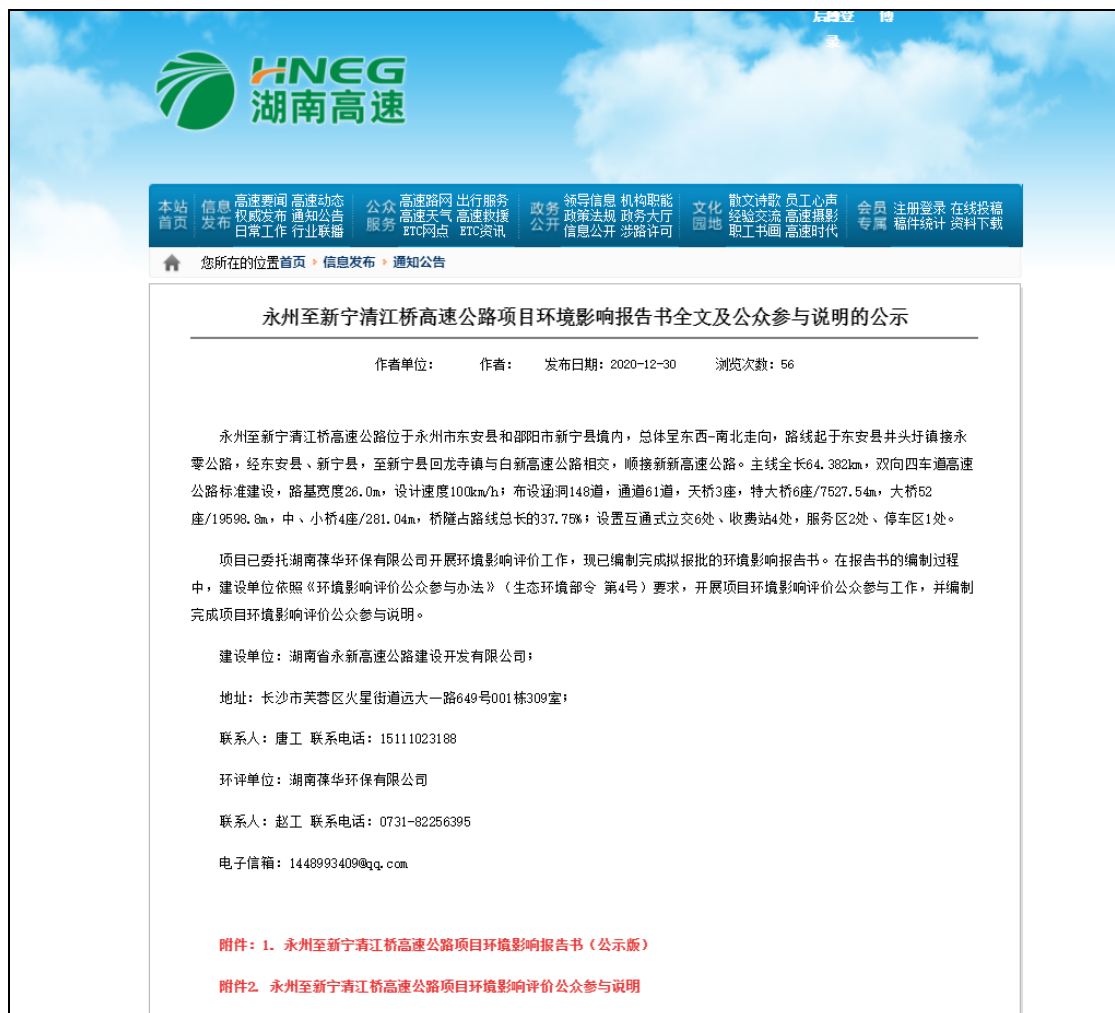
图 4-1 报审前公示网络截图

建设单位于2020年12月30日在湖南省高速公路集团有限公司网站进行了报批前全本公示，网址： http://www.hnsg.net/tabid/65/InfoID/81904/ftid/70/Default.aspx 。