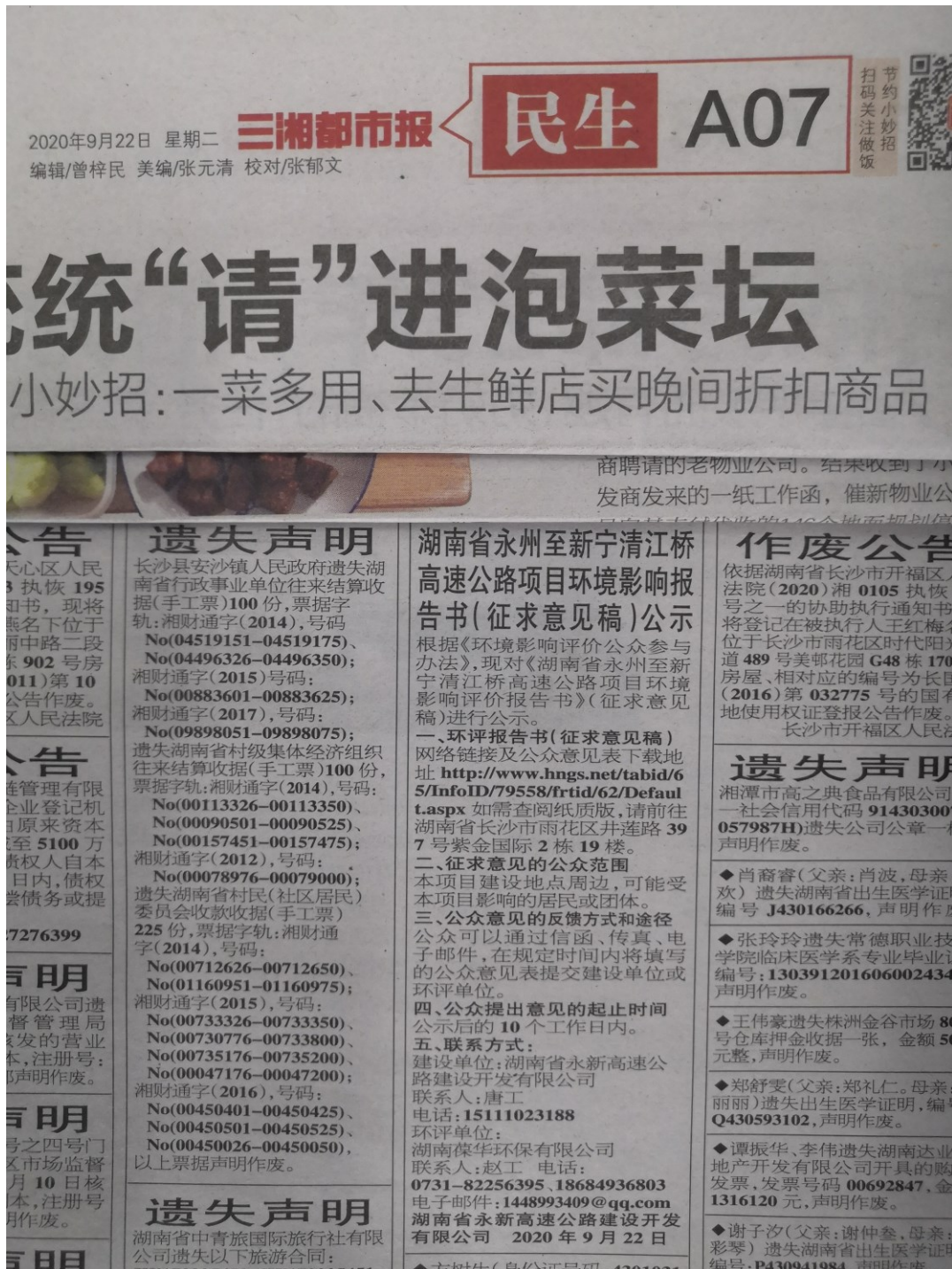
图 3-2 9月22日报纸公示

本次公示选取的报纸为《三湘都市报》，该报刊为湖南省公众接触广泛的报刊类之一，该报刊发布内容也易于被当地群众接受；报纸公开日期为：2020年9月22日、9月24日；公示时间为10个工作日内不少于两次，载体选取和时间符合《环境影响评价公众参与办法》中第十一条的规定。报纸公开情况见下图：