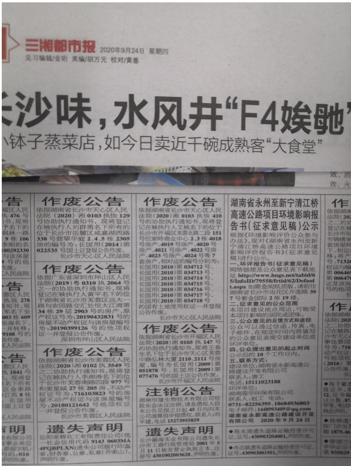
图 3-3 9月24日报纸公示