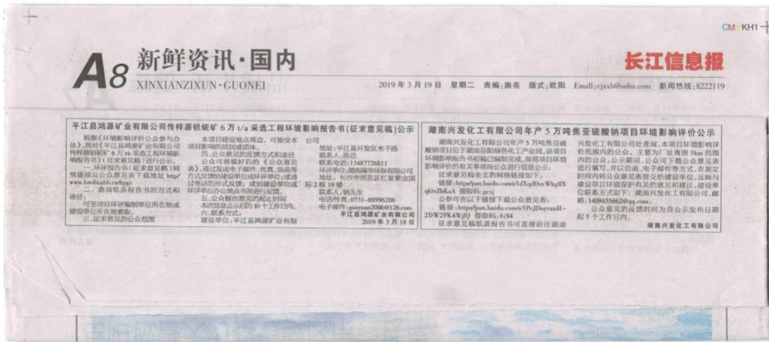
图 3.2-3 2019 年 3 月 19 日在《长江信息报》公示截图