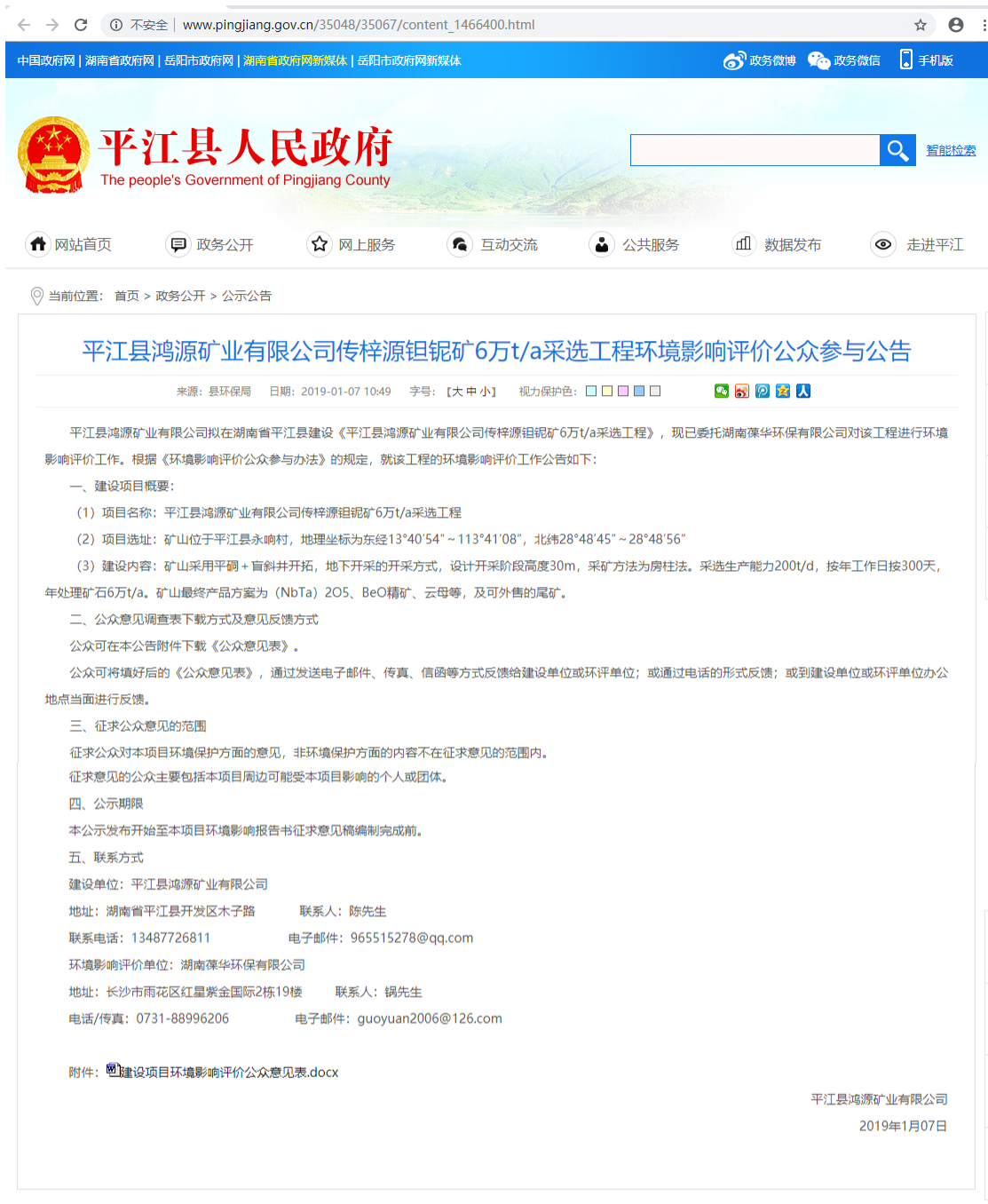
图 2.2-1 2019 年 1 月 7 日网上公示截图