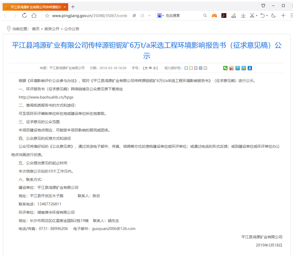
图 3.2-1 征求意见稿网上公示