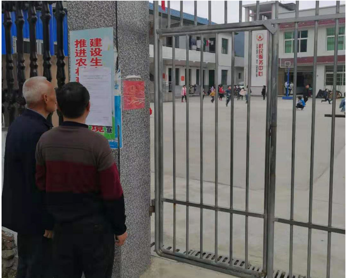
图 3.2-5 征求意见稿现场公示照片