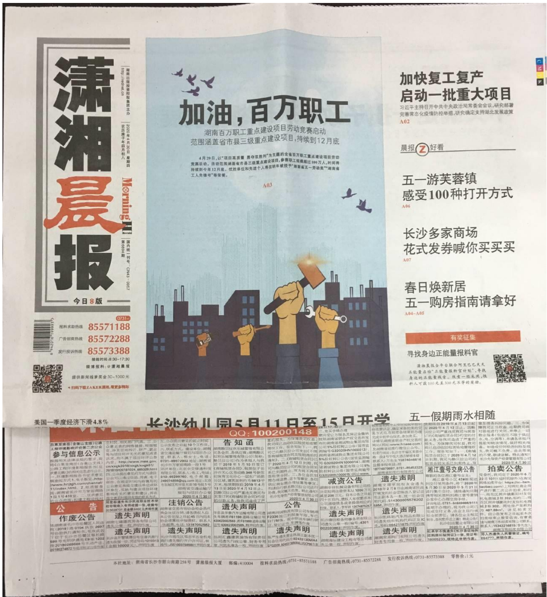
图 3-3 4 月 30 日征求意见稿公示