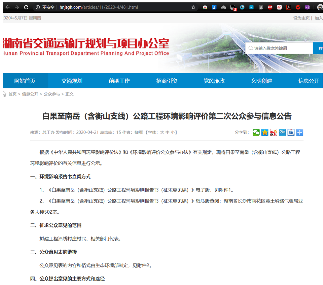
图 3-1 征求意见稿公示