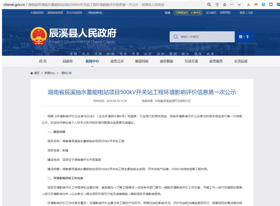
图 2.2-1 网络公示截图