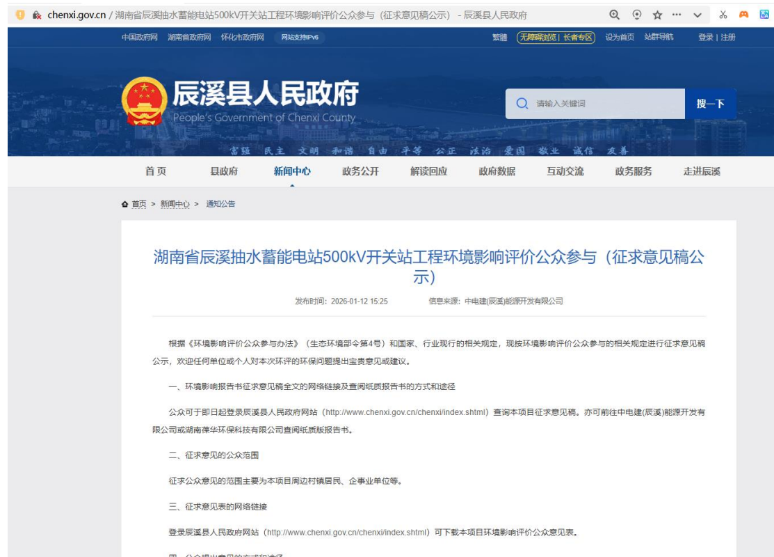
图 3.2-1 征求意见稿网络公示截图