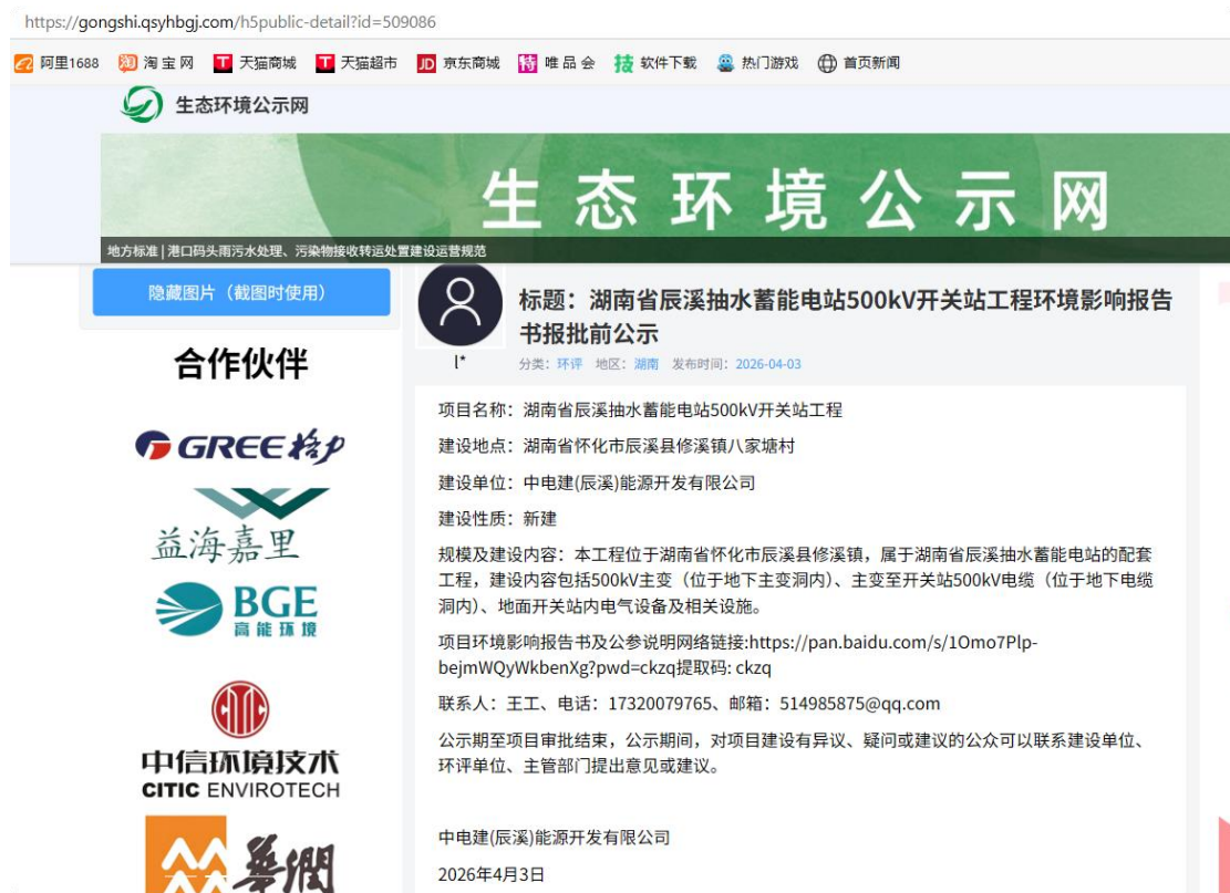
图 6.2-1 报批前报告全本和公参说明网络公示截图